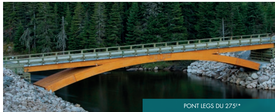
PONT LEGS DU 275E*