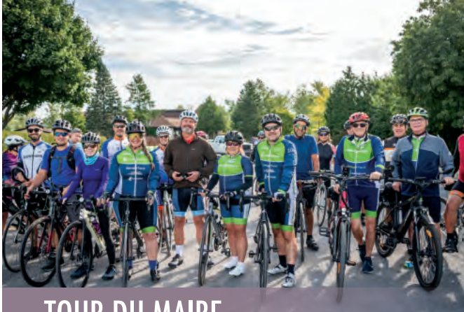
TOUR DU MAIRE