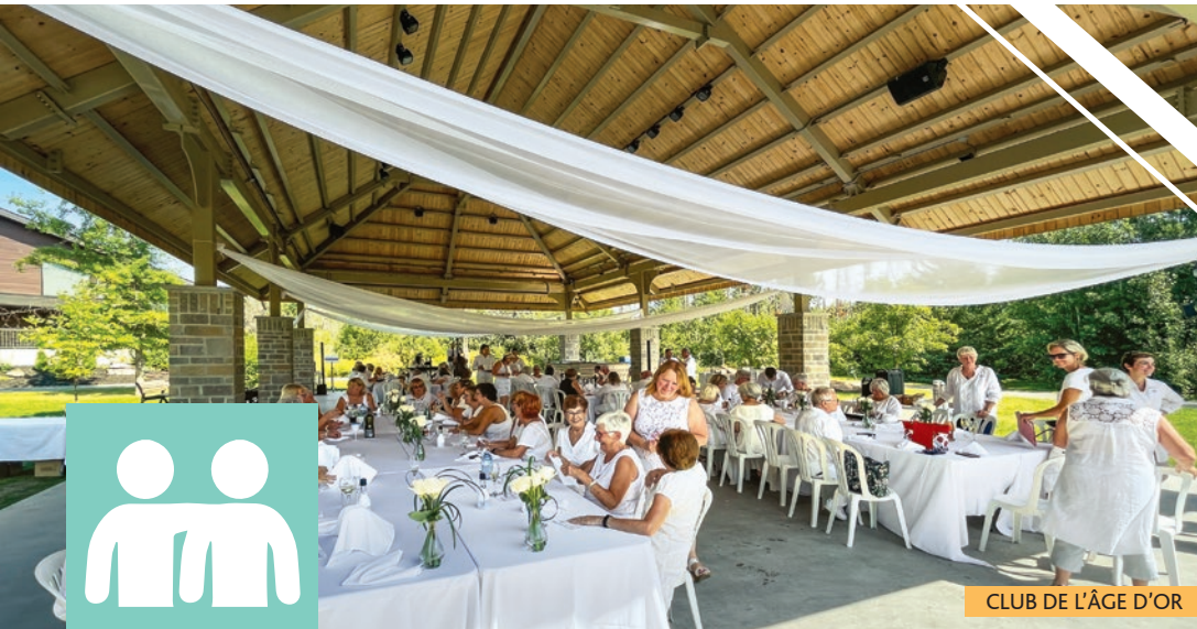
CLUB DE L'ÂGE D'OR