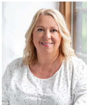
Johanne Di Cesare District de la Biodiversité (6)

Une des entrées principales de notre Ville est la rue Saint-Pierre - Route 132, un accès qui amène nos citoyens et nos visiteurs dans une zone commerciale diversifiée. On y trouve des résidences pour personnes âgées, à prix modiques, avec services spécialisés en soins de santé et naturellement des maisons pour les jeunes familles. Il est important de souligner la présence de l'Exporail - Musée ferroviaire qui est un des plus beaux en Amérique du Nord. Une très belle attraction touristique qui mérite d'être visitée.