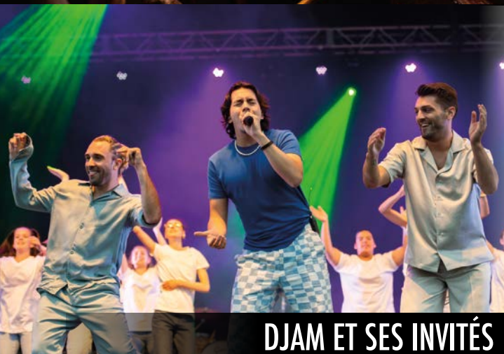
DJAM ET SES INVITÉS

Malgré la pluie, plus de 15 000 personnes ont été au rendez-vous!