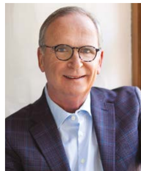
Mari Perron District de la Base de plein air (7)

Consultez la carte interactive au saint-constant.ca pour connaître votre conseiller. Vous voulez prendre rendez-vous? Adressez-vous à mairie@saint-constant.ca ou téléphonez au 450 638-2010, poste 7510.