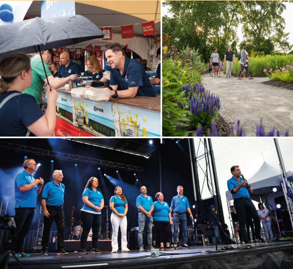
Jean-Claude Boyer Maire de Saint-Constant

En terminant, je vous souhaite un automne des plus réjouissant, rempli de couleurs. Surveillez notre programmation afin de participer à nos prochains rendez-vous citoyens qui sont de merveilleux moments pour discuter avec vous des différents projets en cours ou à venir dans les prochains mois et années ; ils font partie intégrante de la planification stratégique. Ces échanges nous permettent de bonifier et de bâtir ensemble une ville qui nous ressemble et qui nous rassemble !