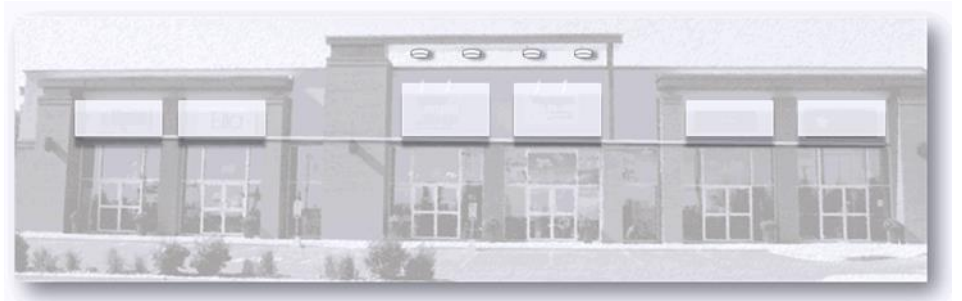
Figure 1 Harmonisation des enseignes

Les couleurs vives et éclatantes ainsi que les éclairages comportant des couleurs fluorescentes ou d’aspect fluorescent sont à proscrire.