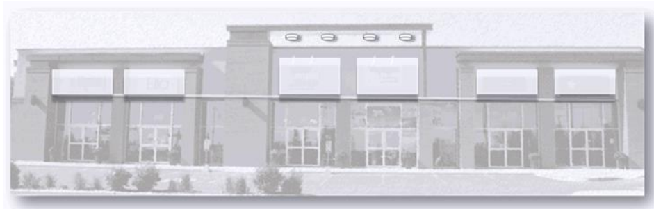
Figure 1 Harmonisation des enseignes

Les couleurs vives et éclatantes ainsi que les éclairages comportant des couleurs fluorescentes ou d’aspect fluorescent sont à proscrire.