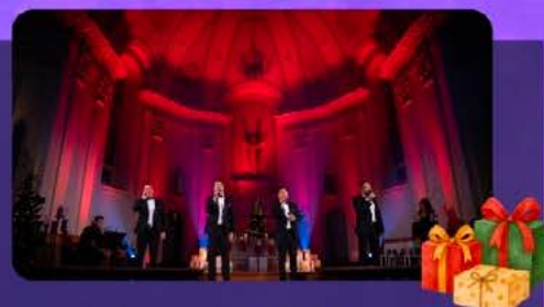
Tocadéo Spectacle de Noël