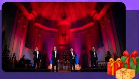
Tocadéo Spectacle de Noël